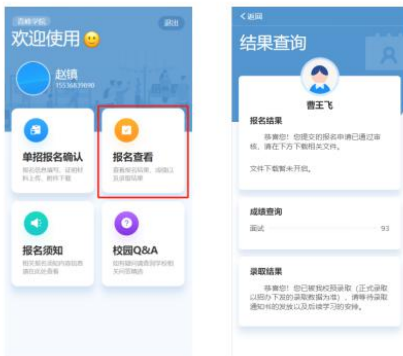
报名结果查询示例图