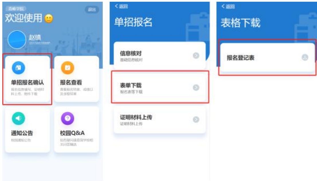
报名登记表等资料下载示例图