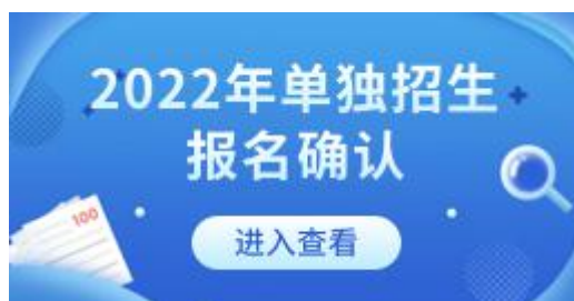
电脑 PC 端入口示例图