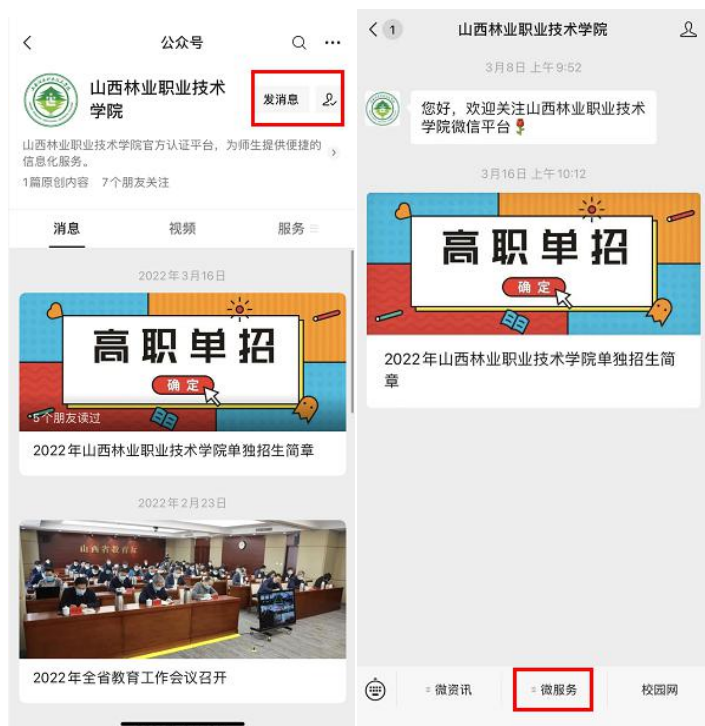
公众号入口示例图

手机端：微信搜索关注“山西林业职业技术学院”公众号，点击“微服务”，选择“单招报名确认”进入登录注册页。